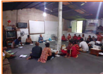
Gleichberechtigung der Geschlechter