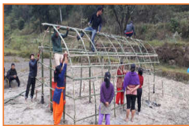
Konstruktion einer Pilzfarm - 1