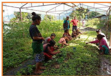
Training in Gemüseanbau

In der gemeinsamen Betreuung einer Dorfgemeinschaft ist der Kollege des Sozialarbeiters („Sozial Mobilizer“) ein Agrarexperte , der „JTA – Junior Technical Assistant“. Er schult und ermutigt die Menschen zu einer besseren Nutzung der landwirtschaftlichen Flächen und im richtigen Anbau ertragreicher Produkte.