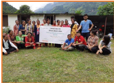
Soziale Kompetenzen und Gruppenverhalten