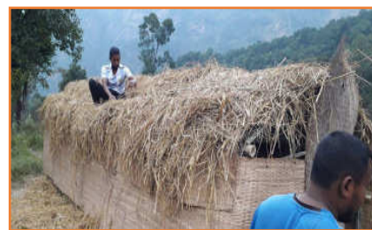
Konstruktion einer Pilzfarm - 2

Der Agrarexperte unterweist die Dorfbewohner im Bau von Bewässerungsanlagen, in der Anlage von Küchengärten, der Konstruktion von Gewächshäusern und dem effektiven Anbau von verschiedenen Produkten. Ferner versorgt er die Bauern mit Samen, Setzlingen und Material für Gewächshäuser. Er instruiert sie auch im richtigen Umgang mit Düngung und Schädlingsbekämpfung. Darüber hinaus organisiert er Schulungen in finanziellen Angelegenheiten – beispielsweise in effektivem Sparen, im Umgang mit Mikrokrediten, Finanzplanung u.v.m.